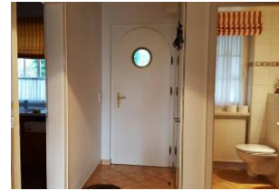
Flur, Gäste WC im EG