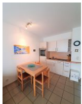
Die Küche ist klein, aber gut ausgestattet