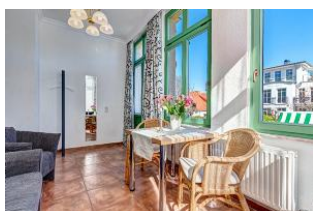
Essen und Wohnen