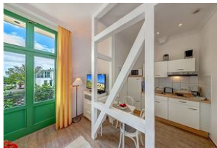
Wohnen / Schlafen