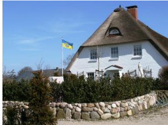
Die Unterkunft befindet sich im 1.OG.

Über einen eigenen Eingang und Treppenhaus mit kleiner Garderobe im Erdgeschoss gelangt man in die geschmackvoll eingerichtete und komfortabel ausgestattete Ferienwohnung in der 1. Etage.