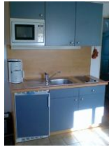
Die Küchenzeile, ausgestattet mit 2-Platten-Ceran-Kochfeld, Mikrowelle und einem Kühlschrank mit Gefrierfach.