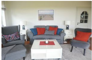
Das Wohnzimmer ist individuell und persönlich gestaltet und dekoriert.

Diese EG-Wohnung für Nichtraucher ist für 2 Pers. gestaltet. Die Strandnähe, absolut ruhige Wohnlage und der besondere Charme der Whg. laden zur Erholung ein. Alle Böden sind mit Fliesen gestaltet. Der Blick über die freien Felder erfreut das Auge. Ein PKW-Stellplatz steht zur Verfügung. Durch die Südausrichtung ist die Wohnung sonnendurchflutet. Der 27 Loch Golfplatz liegt etwa 2 km entfernt, zum Strand sind es ca. 400 m. Hier fühlen Sie sich wie Zuhause!