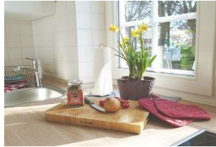
Das lädt zum Kochen mit regionalen Produkten ein.