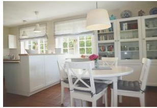
Der runde Esstisch grenzt direkt an die Küche an und wirkt gemütlich.