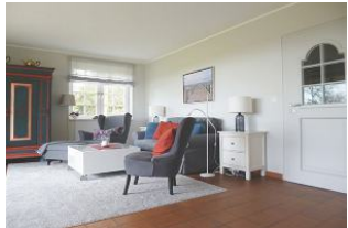
Ein Sofa und zwei Sessel laden zu einem TV-Abend ein.