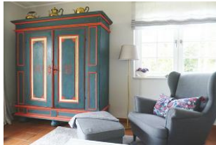
Zur Ausstattung gehören ein LCD-Flatscreen-TV, Bluetooth CD-Player, DVD-Player, Radio und WLAN zur kostenfreien Nutzung.