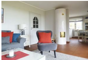
Ein Mylin-Kachelofen sorgt zusätzlich für Behaglichkeit.