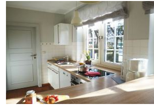
Die Komfortküche mit Geschirrspüler, Backofen, Tiefkühler und Mikrowelle ist reichhaltig ausgestattet.