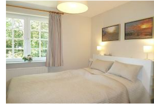
Das kleine heimelige Schlafzimmer mit Doppelbett (160 x 200 cm).