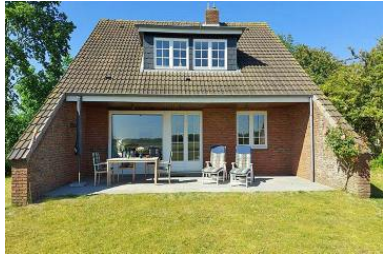
Die Gartenansicht des Ferienhauses im Westerheideweg 11 mit Südterrasse und Garten.