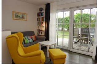
Der gemütliche Sessel mit Blick " ins Grüne....."