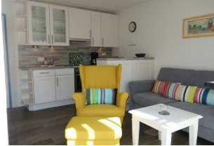
....wer mag sich hier nicht niederlassen ?