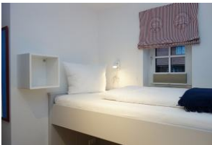
Das obere Bett