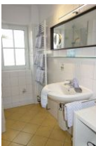
Das Bad mit...