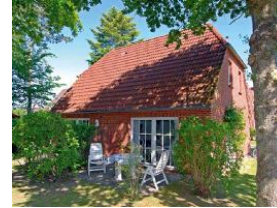
Die Terrasse, schön eingewachsen !