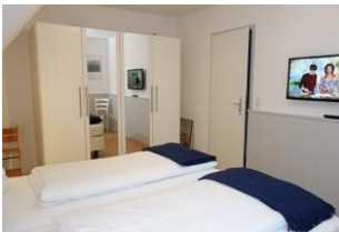
Großer Schrank für düt un dat....