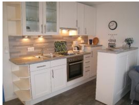
Die Küche mit Backofen.