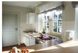
Die Komfortküche mit Geschirrspüler, Backofen, Tiefkühler und Mikrowelle ist reichhaltig ausgestattet.