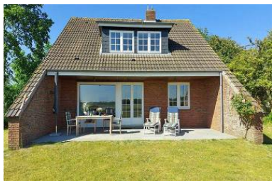
Die Gartenansicht des Ferienhauses im Westerheideweg 11 mit Südterrasse und Garten.