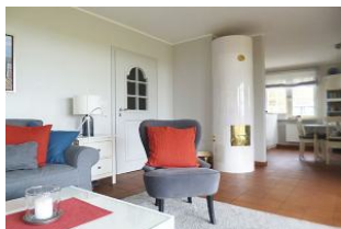
Ein Mylin-Kachelofen sorgt zusätzlich für Behaglichkeit.