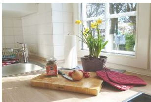
Das lädt zum Kochen mit regionalen Produkten ein.