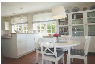
Der runde Eßtisch grenzt direkt an die Küche an und wirkt gemütlich.