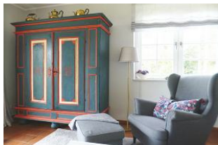
Zur Ausstattung gehören ein LCD-Flatscreen-TV, Bluetooth CD-Player, DVD-Player, Radio und WLAN zur kostenfreien Nutzung.