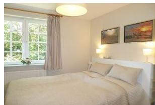
Das kleine heimelige Schlafzimmer mit Doppelbett (160 x 200 cm).