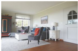
Ein Sofa und zwei Sessel laden zu einem TV-Abend ein.