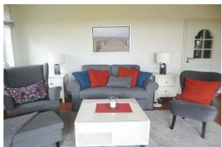
Das Wohnzimmer ist individuell und persönlich gestaltet und dekoriert.

Diese EG-Wohnung für Nichtraucher ist für 2 Pers. gestaltet. Die Strandnähe, absolut ruhige Wohnlage und der besondere Charme der Whg. laden zur Erholung ein. Alle Böden sind mit Fliesen gestaltet. Der Blick über die freien Felder erfreut das Auge. Ein PKW-Stellplatz steht zur Verfügung. Durch die Südausrichtung ist die Wohnung sonnendurchflutet. Der 27 Loch Golfplatz liegt etwa 2 km entfernt, zum Strand sind es ca. 400 m. Hier fühlen Sie sich wie Zuhause!