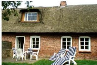
Die Terrasse mit gemütlichen Gartenmöbeln hinter dem Haus