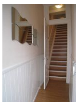
Der schmale Eingang mit Treppe nach oben. 17 Stufen, steil und kurz - Fitness pur

Die ca. 65qm große Wohnung in der 1.Etage des Hauses Promenadenblick bietet ein rundum-Wohlfühlpaket. Esszimmer mit offener Küchenzeile, Wohnzimmer mit gemütlicher Couch und Sessel, sep. Schlafzimmer mit großem Doppelbett. Dazu die Veranda, die den Blick auf das bunte Treiben auf der Promenade, sowie den Strand und das Meer frei gibt. Ein modernes Bad mit großräumiger Dusche. Hier paart sich der Charme eines alten Hauses mit moderner Einrichtung - sehr gelungen. Aber Achtung, allein die alte, lange Treppe in die 1.Etage hat 17 steile, kurze Stufen, die es zu bewältigen gilt.