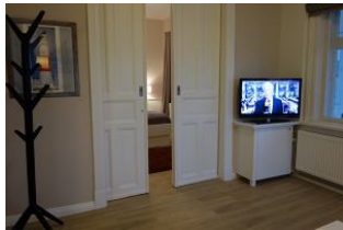
Modernes TV - Flachbild - Gerät Hinter der Schiebetür verbirgt sich...