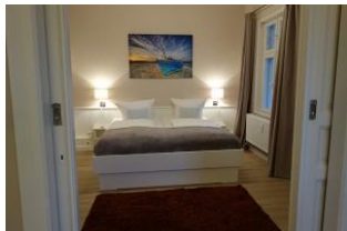
....treten Sie ein und fallen Sie ins Schlummerland !