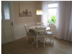
... ein wunderbarer Essplatz mit rundem Tisch...