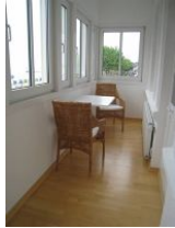
... und ein abklappbarer Tisch mit gemütlichen Korbesseln.