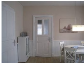
Der Blick von der Küche Richtung Wohnzimmer.