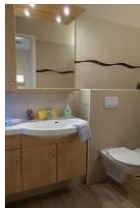
Das Badezimmer mit einem Waschtisch, der viel Platz bietet....