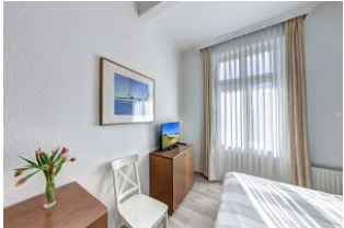
Schlafzimmer 1 mit Zugang zum Balkon