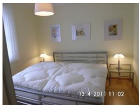
Schlafzimmer mit Doppelbett.