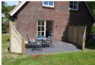
Blick vom Garten auf Terrasse mit Gartenmöbel