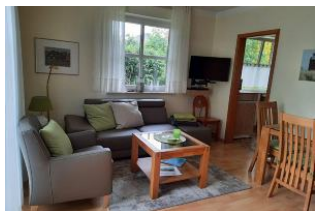
Wohnzimmer mit Esstisch u. 4 Sitzmöglichkeiten