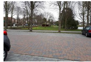
Parkplatz vorm Haus