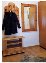
Blick in die Eingangsdielen