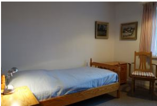
Ein Schlafzimmer mit Einzelbett