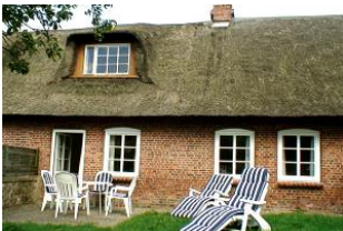
Die Terrasse mit gemütlichen Gartenmöbeln hinter dem Haus