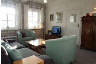
Der alte Schrank und die alte Truhe passen wunderbar zu den Delfter Kacheln.