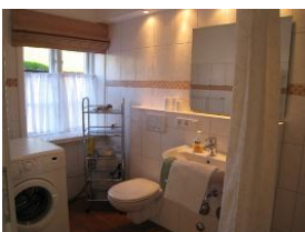
... die Waschmaschine