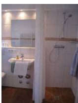
Das moderne Duschbad und .....