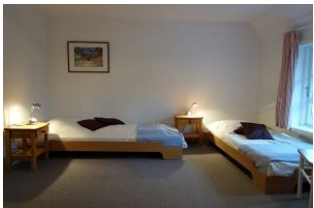
Das dritte Schlafzimmer mit zwei Einzelbetten