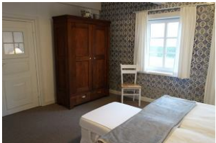
Ein wunderschöner Kleiderschrank.