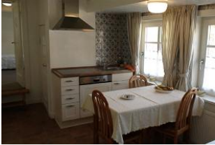
Ein Teil der neuen, modernen Einbauküche