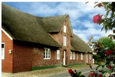
Das Haus "Welkimen tūs" in Oldsum Eingang zur Wohnung "Tradition"