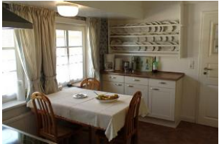
Der andere Teil.....

Entfernungen, zirka: zum Bäcker 50 m, zur Einkaufsmöglichkeit 50 m, zum Flugplatz 8,0 km, zum Golfplatz 8,0 km, zum Hafen 8,0 km, zum Meer 1,0 km, zum Badestrand 3,0 km, zum Ortszentrum 50 m