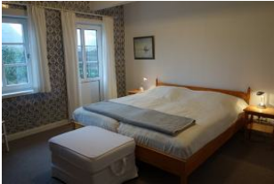
Das Elternschlafzimmer, auch hier die Delfter Kacheln....