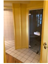
Dampfsauna im Badezimmer