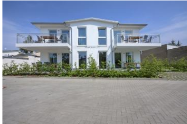
Hausansicht Neubau Villa Margarete