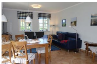
Ein Blick ins Wohn/Esszimmer - einladend....