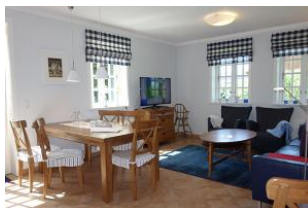
Essplatz und TV Gerät