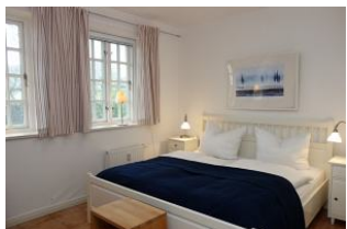
Das Elternschlafzimmer mit großem Doppelbett 180x200cm