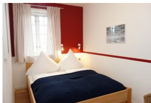
Ein weiteres Schlafzimmer mit Doppelbett 160x200cm