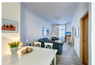
Wohnraum mit direktem Zugang zum Garten und dortiger Terrasse