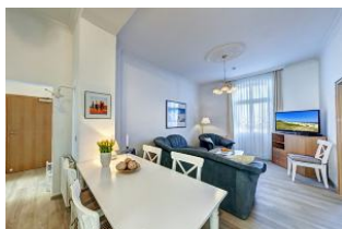
Wohnraum mit direktem Zugang zum Garten und dortiger Terrasse

Direkt an der Strandpromenade mit großem GARTEN und SÜDBALKON! Schönes komfortables 4 - Zimmer - Apartment mit guter und vollwertiger Ausstattung. Drei separate Schlafzimmer, separate Küche, zus. Essplatz im Wohnraum, Duschbad und Gäste-WC, Wohnraum mit direktem Gartenzugang und Terrasse, Südbalkon mit Sonne bis abends. Die Wohnung verfügt über einen Pkw-Stellplatz. In der Garage können Fahrräder und ähnliches untergestellt werden. Im Haus gibt es eine Sauna. Von der "Villa Germania" aus können Sie das Ortszentrum und die bekannte Ahlbecker Seebrücke in ca. 3 Minuten zu Fuß erreichen. Zum Strand sind es 50 m. Von Mai bis September ist ein Strandkorb im Tagespreis enthalten!