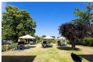
Garten mit Terrassen und Strandkörben (Mai bis September)