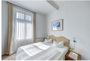
Schlafzimmer 1 mit Zugang zum Balkon