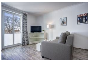
TV und Couch