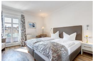
Schlafbereich und Sitzgelegenheit, Zugang zur Dachterrasse

1. Reihe an der Strandpromenade mit DACHTERRASSE und FAHRSTUHL im Haus! Chices 1-Zimmer-Apartment mit moderner guter Ausstattung. Kombiniertes Wohn-/Schlafraum, separate Küche mit Essplatz, Duschbad, Dachterrasse nach Süden mit Sonne bis abends. Die Wohnung verfügt über einen Pkw-Stellplatz. In der Garage können auch Fahrräder und ähnliches untergestellt werden. In unserer "Villa Germania" nebenan gibt es eine Sauna. Von der "Villa Aquamarina" sind es zum Ortszentrum und der Seebrücke ca. 3 Minuten zu Fuß. Zum Strand sind es 50 m.