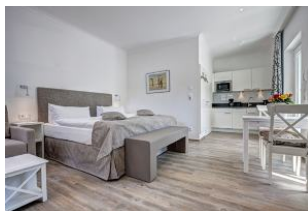
Wohn- und Schlafräum