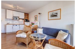
Wohnbereich, Essbereich, Küchenzeile