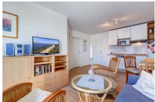
Wohnbereich, Essbereich, Küchenzeile

1. Reihe, direkt an der Strandpromenade mit BALKON und FAHRSTUHL im Haus! Schönes gemütliches 2-Zimmer-Apartment mit moderner guter Ausstattung. Separates Schlafzimmer, Wohnzimmer mit Küchenzeile und Essplatz, Duschbad, Balkon nach Osten - zum Frühstück in der Sonne mit SEEBLICK. Die Wohnung verfügt über einen Tiefgaragen-Pkw-Stellplatz. In der Garage können auch Fahrräder und ähnliches untergestellt werden. In unserer "Villa Germania" nebenan gibt es eine Sauna. Von der "Villa Aquamarina" sind es zum Ortszentrum und der Seebrücke ca. 3 Minuten zu Fuß. Zum Strand sind es 50 m.