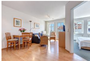
Wohnbereich, Essbereich, Blick zum Schlafzimmer