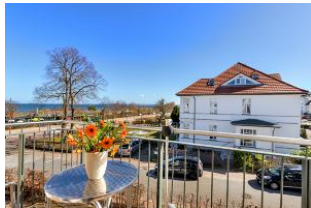
Balkon mit Ausblick