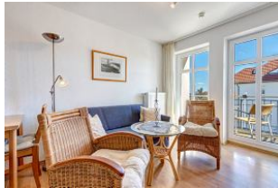
Wohnbereich Sitzecke, Blick zur Balkontür