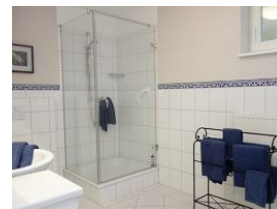
Das Duschbad im UG, daneben noch ein Abstellraum und die Waschmaschine.