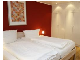
Ein weiteres Schlafzimmer (UG) mit großem Doppelbett und Einbauschränk