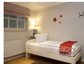
...das zweite Bett.