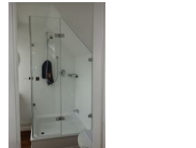
Das kleine Duschbad im Dachgeschoß mit neuer Duschkabine....