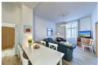
Wohnraum mit direktem Zugang zum Garten und dortiger Terrasse

Direkt an der Strandpromenade mit großem GARTEN und SÜDBALKON! Schönes komfortables 4 - Zimmer - Apartment mit guter und vollwertiger Ausstattung. Drei separate Schlafzimmer, separate Küche, zus. Essplatz im Wohnraum, Duschbad und Gäste-WC, Wohnraum mit direktem Gartenzugang und Terrasse, Südbalkon mit Sonne bis abends. Die Wohnung verfügt über einen Pkw-Stellplatz. In der Garage können Fahrräder und ähnliches untergestellt werden. Im Haus gibt es eine Sauna. Von der "Villa Germania" aus können Sie das Ortszentrum und die bekannte Ahlbecker Seebrücke in ca. 3 Minuten zu Fuß erreichen. Zum Strand sind es 50 m. Von Mai bis September ist ein Strandkorb im Tagespreis enthalten!