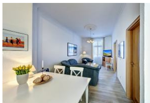
Wohnraum mit direktem Zugang zum Garten und dortiger Terrasse