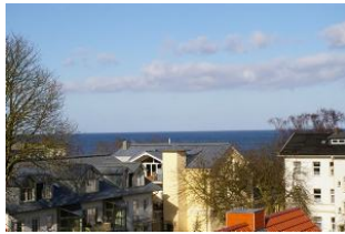
Seeblick aus der Veranda Ostseewarte Nr. 14