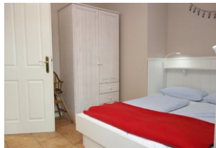
Auch dieses Schlafzimmer bietet einen Kleiderschrank