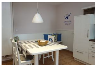
Der Essplatz ... Auf die Teller fertig los !