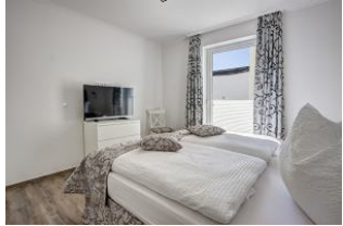
Schlafzimmer mit Flachbild TV