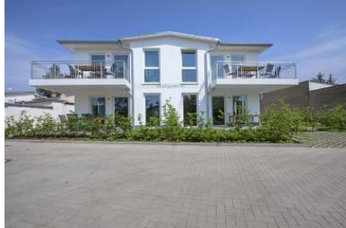
Hausansicht Neubau Villa Margarete