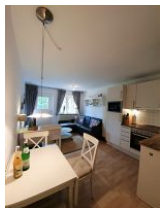
Das moderne Wohnzimmer mit offener Küchenzeile.

Herzlich Willkommen in der Wohnung Traumkoje. Die Wohnung ist hell, freundlich und modern eingerichtet und befindet sich in einem typischen Reetdachhaus. Umgeben von Feldern und viel Natur können Sie hier entspannen und Kraft tanken. Die Wohnung verteilt sich auf zwei Ebenen. Im EG befinden sich ein großer Wohnraum mit Essecke, einer gemütlichen Couch, einer gut ausgestatteten Küchenzeile sowie einem Gäste - WC. Im 1. OG befinden sich das Schlafzimmer und das Duschbad. Vor dem Haus steht Ihnen ein eigener Parkplatz zur Verfügung.