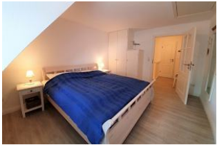
Der Einbauschränk bietet viel Platz für das Urlaubsgepäck.