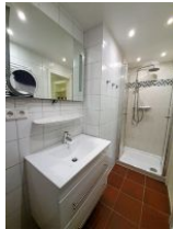
Die große Dusche im 1. OG.