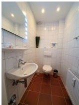
Im EG befindet sich ein zusätzliches WC.