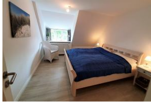
Das Schlafzimmer mit großem Doppelbett (180x200).