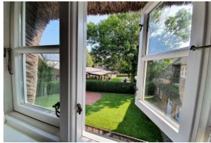
Der Blick aus dem Schlafzimmerfenster.