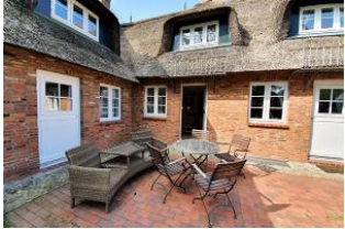
Der schöne Sitzplatz.