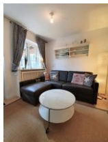
Die gemütliche Couchecke.