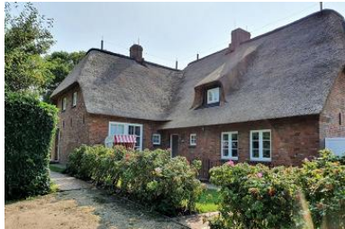
Das wunderschöne Reetdachhaus von außen.

Die Unterkunft verteilt sich über EG und 1.OG.