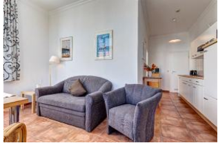
Wohnbereich mit Blick zur Küchenzeile