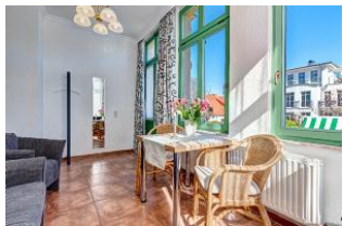
Essen und Wohnen