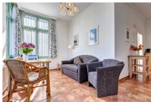
Essen und Wohnen