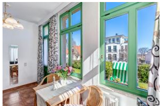
Essplatz mit Blick zur Terrasse mit Strandkorb

STRANDNAH! Nur ca. 100 m zur Strandpromenade mit TERRASSE, KLEINEM GARTEN und STRANDKORB! Gemütliches 2-Zimmer-Apartment mit freundlicher Ausstattung. Separates Schlafzimmer, Wohnzimmer mit Schlafcouch, Küchenzeile, Essplatz, geräumiges Duschbad, Terrasse mit Gartenmöbeln und STRANDKORB (Frühling bis Herbst) und kleinem Gartenstück, separater Eingang. Die Wohnung verfügt über einen Pkw-Stellplatz . Abstellraum für Fahrräder und ähnliches ist vorhanden. Eine Sauna in der "Villa Germania" kann kostenpflichtig genutzt werden. Vom Haus aus können Sie das Ortszentrum und die bekannte Ahlbecker Seebrücke in ca. 3 bzw. 5 Minuten zu Fuß erreichen.