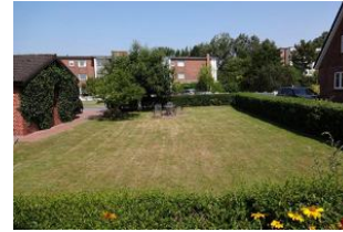
Der herrliche Außenbereich.