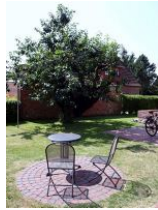
Ihr eigener Sitzbereich an der Südseite.