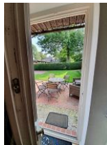
Ihr Sitzplatz im Freien.