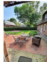
Viel Platz bietet die Terrasse.