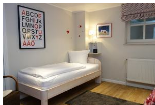
Ein Schlafzimmer mit 2 Einzelbetten, je 90x200cm