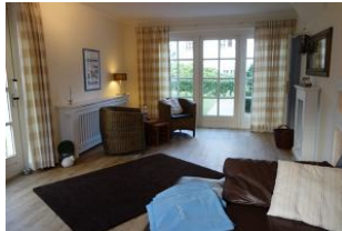
Eine kleine Sitzzecke mit zwei Sesseln....