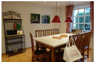
Herrlich - eine sep. Küche....