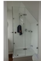
Das kleine Duschbad im Dachgeschoß mit neuer Duschkabine....