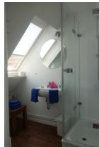
...und Handwaschbecken, nicht im Bild, die Toilette