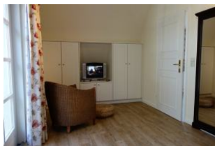
Ein Plätzchen zum "zurück ziehen" im Schlafzimmer