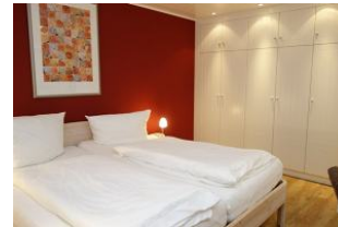
Ein weiteres Schlafzimmer (UG) mit großem Doppelbett und Einbauschränk