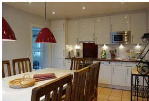
....an diesen Tisch passt die ganze Familie !