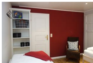
Ein offener Schrank und Garderobenpaneel