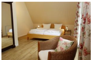
Das große Elternschlafzimmer im OG, nicht im Bild: TV Gerät