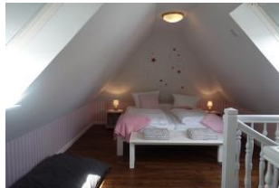
Das Schlafzimmer im Dachgeschoß mit Doppelbett 180x200 und sep. Duschbad.