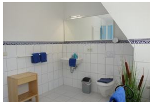
Das große Badezimmer im OG mit....