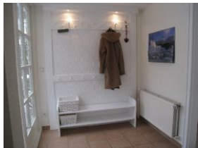
Der Eingangsbereich mit großer Garderobe

Idyllischer kann man mitten in der Stadt kaum wohnen. Das Haus Johanna liegt in der Feldstrasse in zweiter Reihe. Zum Strand sind es nur 3 Gehminuten, zum Bäcker ebenfalls. Herrlich, auf der Terrasse sitzen und es sich gut gehen lassen - hören werden Sie außer dem eigenen Familiengeplapper nur das Geklapper der auf Föhr lebenden Störche von nebenan. Idylle in der Stadt .....! Vier Schlafräume, drei Bäder und gemeinschaftliche Räume lassen auch der Großfamilien oder befreundeten Familien genügend Raum zur Erholung. Neuigkeiten: nebenan, im gleichen Haus gibt es jetzt noch eine Wohnung für 4-5 Personen - unsere Johanna 2