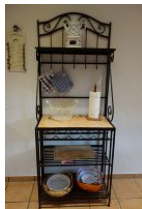
Modernes Sideboard ..