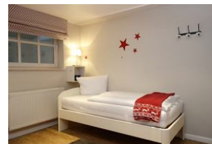
...das zweite Bett.