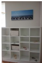
Der Eingangsbereich mit viel Platz für Schuhe