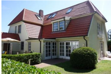
Die Aussenansicht des Hauses Johanna in der Feldstrasse.

Die Unterkunft verteilt sich über EG, UG und 1.OG.