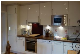
Die offene Küchenzeile mit Ceranfeld, Backofen, Geschirrspüler, Kühlschrank.