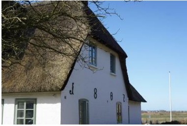
Die Unterkunft befindet sich im 1.OG.

Die nordfriesische Insel Föhr ist bekannt für ihre idyllischen Friesendörfer und ihre malerische Marschlandschaft. Eines dieser charmanten Dörfer ist Midlum, wo sich unser Ferienhaus aus dem Jahr 1807 befindet. Das Haus grenzt direkt an Wiesen und Felder und besticht mit seinem typischen Reetdach und dem authentischen friesischen Charme. Von hier aus genießt du einen atemberaubenden Blick bis hin zum Deich, der kilometerweit entfernt liegt. Ein Aufenthalt in diesem Ferienhaus bietet somit nicht nur Erholung und Entspannung, sondern auch die Möglichkeit, die Schönheit der Föhrer Landschaft hautnah zu erleben. Das gesamte Haus bietet ausreichend Raum und Privatsphäre für zwei Familien, Freunde oder mehrere Generationen. Es gibt zwei Ferienwohnungen, die sich auf Erd- und Obergeschoss verteilen. Die Wohnungen sind komplett autark voneinander nutz- und buchbar. Gleichzeitig lassen sich die Wohnungen und Gärten wunderbar miteinander kombinieren. Das über 1000 m 2 große Grundstück ist dank seiner Gartenlandschaft mit Hecken und Zäunen zur Nachbarschaft gut abgegrenzt. Der Garten teilt sich jeweils für die Wohnungen auf. Sitzcken und Strandkörbe laden zu Ruhe und Entspannung an sonnigen Nachmittagen ein.