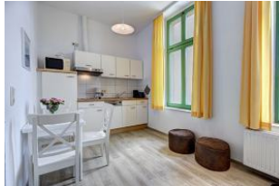
Küche und Essen