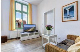
Wohnbereich mit TV

STRANDNAH mit SÜDBALKON! Nur ca. 100 m zur Strandpromenade! Schönes 2-Zimmer-Apartment mit gemütlicher und guter Ausstattung. Separates Schlafzimmer, Wohnzimmer mit Küchenzeile und Essplatz, Duschbad, Südbalkon. Die Wohnung verfügt über einen Pkw-Stellplatz. Abstellraum für Fahrräder und ähnliches ist vorhanden. Eine Sauna in der "Villa Germania" kann kostenpflichtig genutzt werden. Vom Haus aus können Sie das Ortszentrum und die bekannte Ahlbecker Seebrücke in ca. 3 bzw. 5 Minuten zu Fuß erreichen.