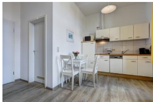
Küche und Essen mit Blick zur Badtür