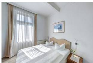
Schlafzimmer 1 mit Zugang zum Balkon