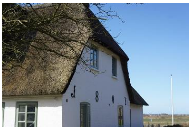
Die Unterkunft befindet sich im 1.OG.

Die nordfriesische Insel Föhr ist bekannt für ihre idyllischen Friesendörfer und ihre malerische Marschlandschaft. Eines dieser charmanten Dörfer ist Midlum, wo sich unser Ferienhaus aus dem Jahr 1807 befindet. Das Haus grenzt direkt an Wiesen und Felder und besticht mit seinem typischen Reetdach und dem authentischen friesischen Charme. Von hier aus genießt du einen atemberaubenden Blick bis hin zum Deich, der kilometerweit entfernt liegt. Ein Aufenthalt in diesem Ferienhaus bietet somit nicht nur Erholung und Entspannung, sondern auch die Möglichkeit, die Schönheit der Föhrer Landschaft hautnah zu erleben. Das gesamte Haus bietet ausreichend Raum und Privatsphäre für zwei Familien, Freunde oder mehrere Generationen. Es gibt zwei Ferienwohnungen, die sich auf Erd- und Obergeschoss verteilen. Die Wohnungen sind komplett autark voneinander nutz- und buchbar. Gleichzeitig lassen sich die Wohnungen und Gärten wunderbar miteinander kombinieren. Das über 1000 m 2 große Grundstück ist dank seiner Gartenlandschaft mit Hecken und Zäunen zur Nachbarschaft gut abgegrenzt. Der Garten teilt sich jeweils für die Wohnungen auf. Sitzcken und Strandkörbe laden zu Ruhe und Entspannung an sonnigen Nachmittagen ein.