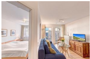
Blick in den Wohnraum