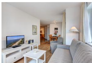
Wohnbereich mit Blick zum Essplatz