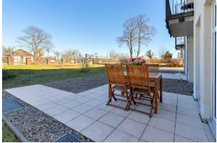
Terrasse mit Blick in den Garten und zur Promenade