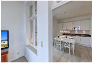
Blick in die Wohnküche