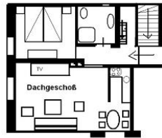
Der Grundriss der Wohnung.