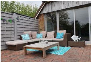
Die Gemeinschaftsterrasse vor dem Haus