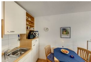
Küche mit Esszimmer