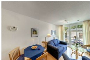
Essbereich und Wohnzimmer

Direkt an der Strandpromenade mit BALKON und FAHRSTUHL im Haus! Schönes geräumiges 2-Zimmer-Apartment mit moderner guter Ausstattung. Separates Schlafzimmer, Wohnzimmer mit Küchenzeile und Essplatz, Duschbad, Balkon zur Westseite mit Abendsonne. Die Wohnung verfügt über einen Tiefgaragen-Pkw-Stellplatz. In der Garage können auch Fahrräder und ähnliches untergestellt werden. In unserer "Villa Germania" nebenan gibt es eine Sauna. Von der "Villa Aquamarina" aus können Sie das Ortszentrum und die bekannte Ahlbecker Seebrücke in ca. 3 Minuten zu Fuß erreichen. Zum Strand sind es 50 m.