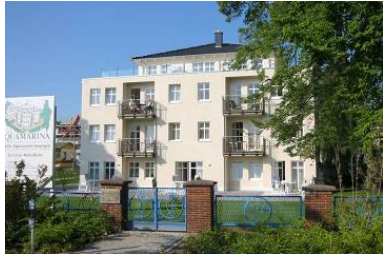
Architekturansicht "Villa Aquamarina" von der Promenade