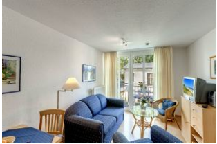
heller Wohnbereich mit Fernseher