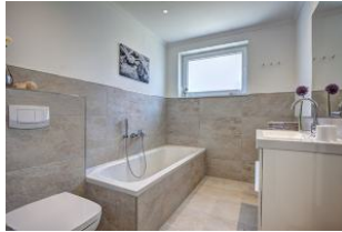
Bad mit Badewanne