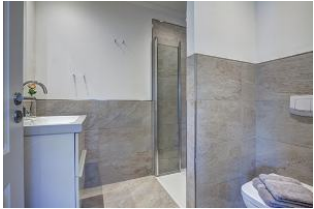
Bad mit Dusche