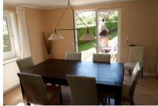
Wohnen im Haus Lindemann