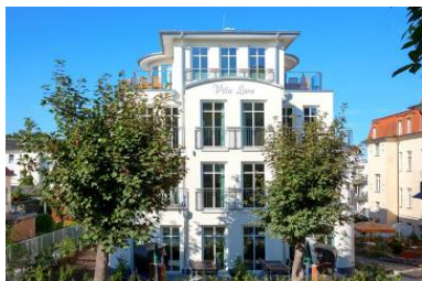
Hausansicht aus der Architektenplanung