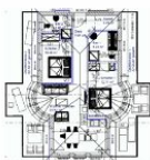
Wohnungsgrundriss (Möblierung exemplarisch)