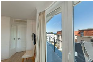
Blick aus Schlafzimmer