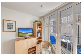
TV und Balkon

Direkt an der Strandpromenade mit SÜDBALKON und FAHRSTUHL im Haus! Schönes gemütliches 2-Zimmer-Apartment mit moderner guter Ausstattung. Separates Schlafzimmer (mit Fernseher), Wohnzimmer mit Küchenzeile und Essplatz, Duschbad, Balkon nach Süden mit Sonne bis abends. Die Wohnung verfügt über einen Tiefgaragen-Pkw-Stellplatz. In der Garage können auch Fahrräder und ähnliches untergestellt werden. In unserer "Villa Germania" nebenan gibt es eine Sauna. Von der "Villa Aquamarina" sind es zum Ortszentrum und der Seebücke ca. 3 Minuten zu Fuß. Zum Strand sind es 50 m.