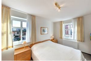
Schlafzimmer mit Fernseher