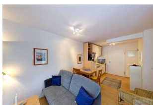
Wohnbereich und Küchenzeile