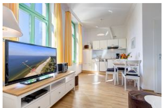
Wohnbereich mit Blick zu Küchenzeile und Essplatz