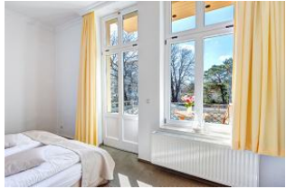
Schlafzimmer mit Blick zum Balkon