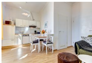
Wohnbereich mit Blick zu Küchenzeile und Essplatz