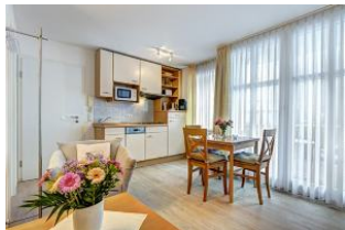
Küche, Wssen, Wohnen

1. Reihe, direkt an der Strandpromenade mit SÜDBALKON! FAHRSTUHL im Haus! Schönes 2-Zimmer-Apartment mit moderner guter Ausstattung. Separates Schlafzimmer (mit Fernseher), Wohnzimmer mit Küchenzeile mit Essplatz, Duschbad, Balkon zur Südseite mit Sonne bis abends. Die Wohnung verfügt über einen Pkw-Stellplatz. In der Garage können auch Fahrräder und ähnliches untergestellt werden. Von der "Villa Aquamarina" aus können Sie das Ortszentrum und die bekannte Ahlbecker Seebrücke in ca. 3 Minuten zu Fuß erreichen. Zum Strand sind es 50 m.