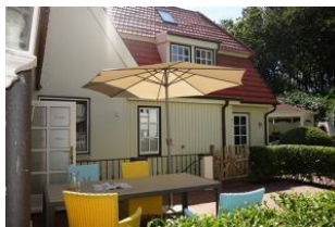
Die Terrasse mit großem Tisch und herrlich bequemen Sesseln.