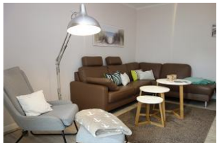
... hier noch einmal die Couch !