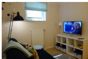
...TV Gerät und DVD Player