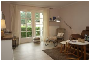
...hier noch einmal das Wohnzimmer..