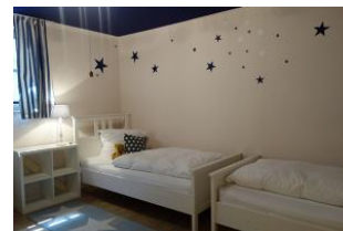
Das Schlafzimmer in der U 20 Zone mit 2 Einzelbetten 90x200cm, Sternenhimmel.....