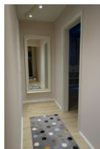
Der Flur führt rechts ins Schlafzimmer, links ins Spielzimmer