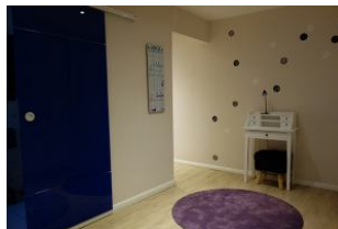
Hinter der Glastür verbirgt sich ....