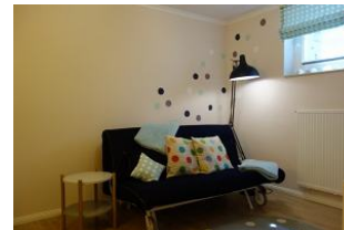
Das Spielzimmer mit Schlafcouch für Besuch...