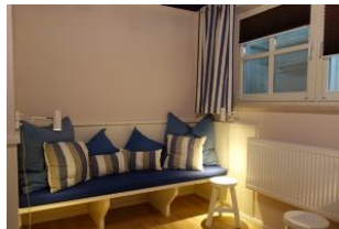
...herrlicher "Chillbank" !