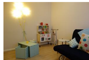
...und für unsere kleinen Gäste ein Tisch mit Stühlen und eine Spielküche