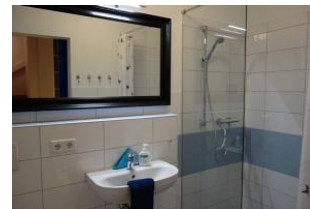
... ein Duschbad mit großer, bodengleicher Duschkabine, Handwaschbecken und Toilette