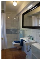
Das Duschbad im Erdgeschoß