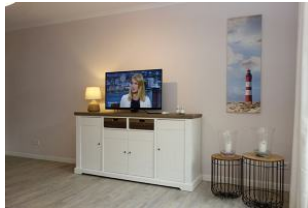
...TV Gerät und DVD Player ....