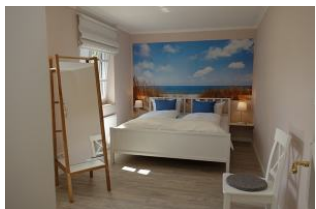
Das Elternschlafzimmer mit Nordseefeeing ....