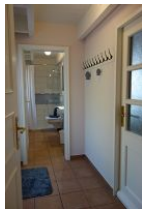
Der kleine Flur führt ins Bad. Rechts die Tür in die Garage, links die Tür auf die Terrasse