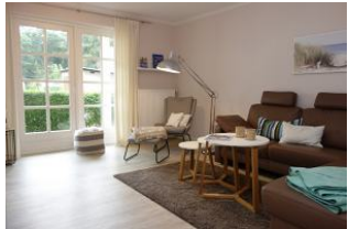
Das Wohnzimmer mit gemütlichem Leseplatz, großer Eckcouch....